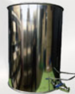
벌꿀/주정용 (밸브장착 드럼)